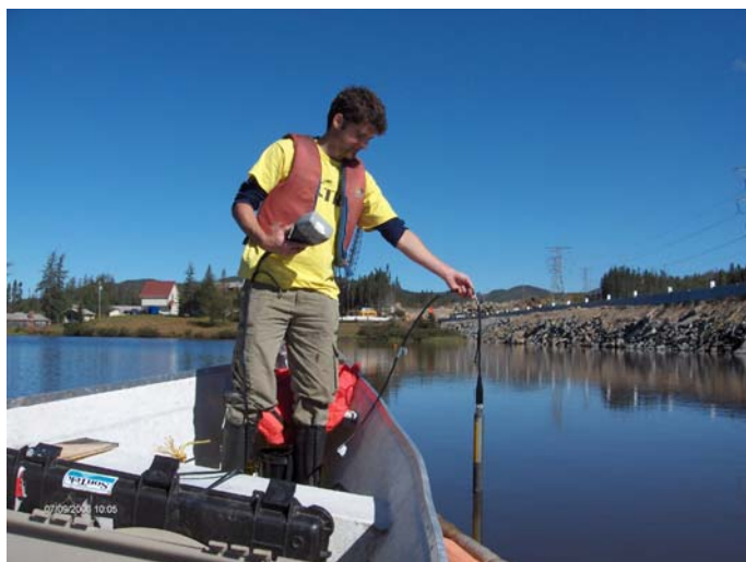
Figure 7. Profil physico-chimique au lac Horatio-Walker.

En plus du profil physico-chimique, des échantillons d'eau ont été prélevés dans l'épilimnion et l'hypolimnion de chacun des lacs. Ces échantillons ont ensuite été envoyés au laboratoire du professeur Rosa Galvez-Cloutier de l'Université Laval pour analyse. Ces analyses d'eau visent à quantifier la concentration de chlorure (Cl) et de sodium (Na).