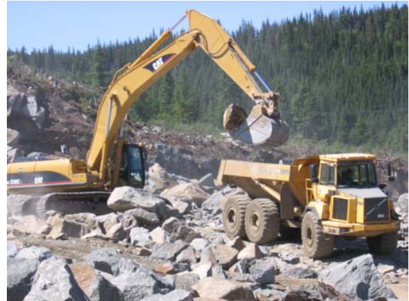
Figure 1. Chantier de construction au ruisseau des Brûlés (km 124.81).

Durant l'étiage estival, de nombreux tubes collecteurs de trappe de type sédibloc (Figure 3) se sont retrouvés exondés en raison du faible niveau d'eau. Afin d'éviter cette situation, les tubes collecteurs ont été coupés de quelques centimètres. Cette modification a permis d'immerger la plupart des sédiblocs en période d'étiage. Un couvercle perforé a également été ajouté sur les tubes collecteurs (Figure 4) afin de réduire la turbulence et ainsi la remise en suspension des sédiments fins déjà accumulés dans le tube collecteur.