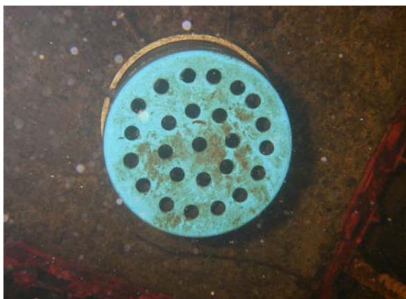
Figure 4. Couvercle perforé disposé sur le tube collecteur d'un sédibloc.