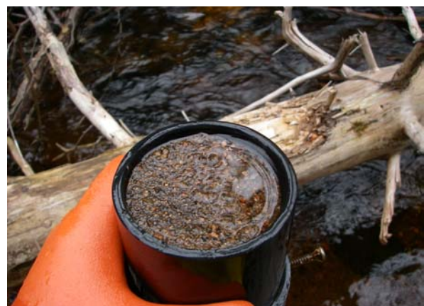
Figure 3. Sédiments récoltés à l'aide d'une trappe de type sédibloc.