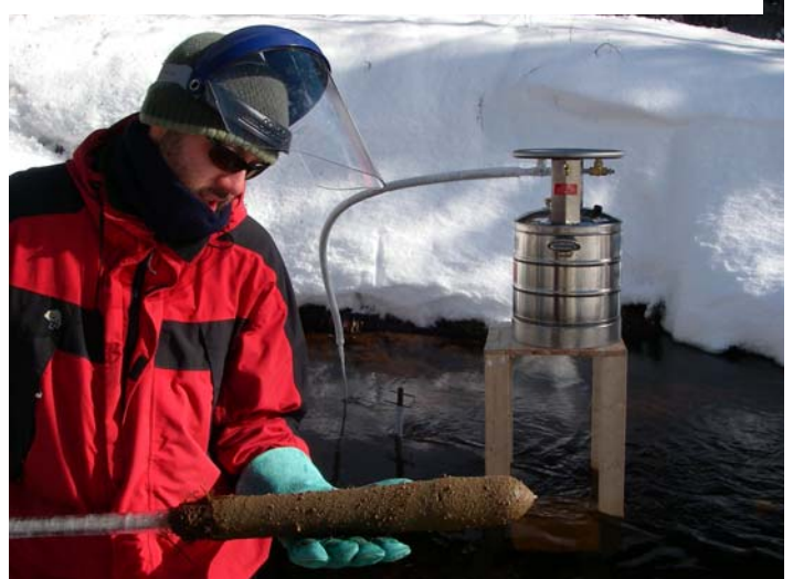
Figure 5. Échantillon de sédiments obtenu à l'aide de la technique de carottage cryogénique.

Des carottes cryogéniques ont également été prélevées dans le tributaire du lac Jacques-Cartier, près des incubateurs, en amont et en aval de la route. Cette expérience permettra de relier la présence des particules fines au succès d'éclosion des œufs d'omble de fontaine. En quantifiant le lessivage naturel des cours d'eau, il sera ainsi possible de mieux interpréter les données obtenues à l'aide des trappes à sédiments et d'estimer l'impact réel des sédiments sur le succès de reproduction de l'omble de fontaine.