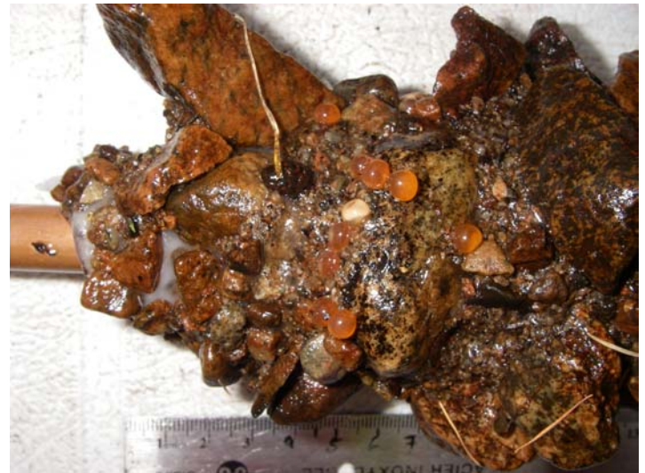
Figure 6. Vue rapprochée d'une carotte cryogénique. Sur cet échantillon, il est possible d'observer des œufs d'omble de fontaine déposés à une profondeur d'environ 5 à 7 centimètres.