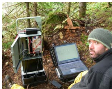
Figure 8. Téléchargement des données enregistrées par une station.

Un aperçu du type de graphique obtenu à partir des données d'une station permanente est présenté à la figure 9. Sur ce graphique seulement deux paramètres sont illustrés afin de simplifier la représentation. Ces données ont été enregistrées entre le 18 septembre et le 13 novembre 2006 (7848 données !), à la station aval d'un tributaire de la rivière Simoncouche.