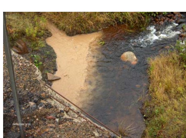
Figure 2. Sédiments en suspension amenés par le lessivage d'une zone de construction après une forte pluie (décharge du lac Chominich km 133.11).