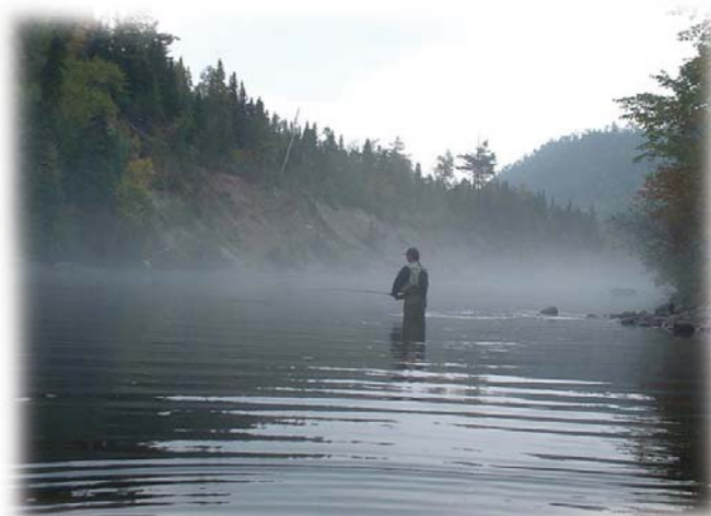
Brume sur la Sainte-Marguerite ; un matin de pêche à l'omble fontaine sur la Sainte-Marguerite.

Dans plusieurs rivières du Québec, nous avons le grand bonheur d'admirer et de pêcher la truite de mer. La truite de mer est en fait, celle que l'on nomme familièrement la truite mouchetée ou l'omble de fontaine ( Salvelinus fontinalis ) mais dans le cas de la truite de mer, il s'agit d'un poisson anadrome, c'est-à-dire que, comme le saumon, il effectue une migration en eau salée et remonte en eau douce pour la reproduction. Dans les mêmes rivières, se retrouvent aussi des truites mouchetées résidentes, qui n'entreprennent pas de migration vers la mer. Une seule et même espèce, deux cycles de vie. Moins bien connue que son cousin saumon Salmo salar , Salvelinus fontinalis est tout de même une vedette montante de nos eaux, vers qui plusieurs pêcheurs (et en l'occurrence des chercheurs !) se tournent, surtout depuis les déboires de Salmo , qui semblent toutefois s'atténuer cette année... Salvelinus sort tranquillement de l'ombre avec son lot de mystères.