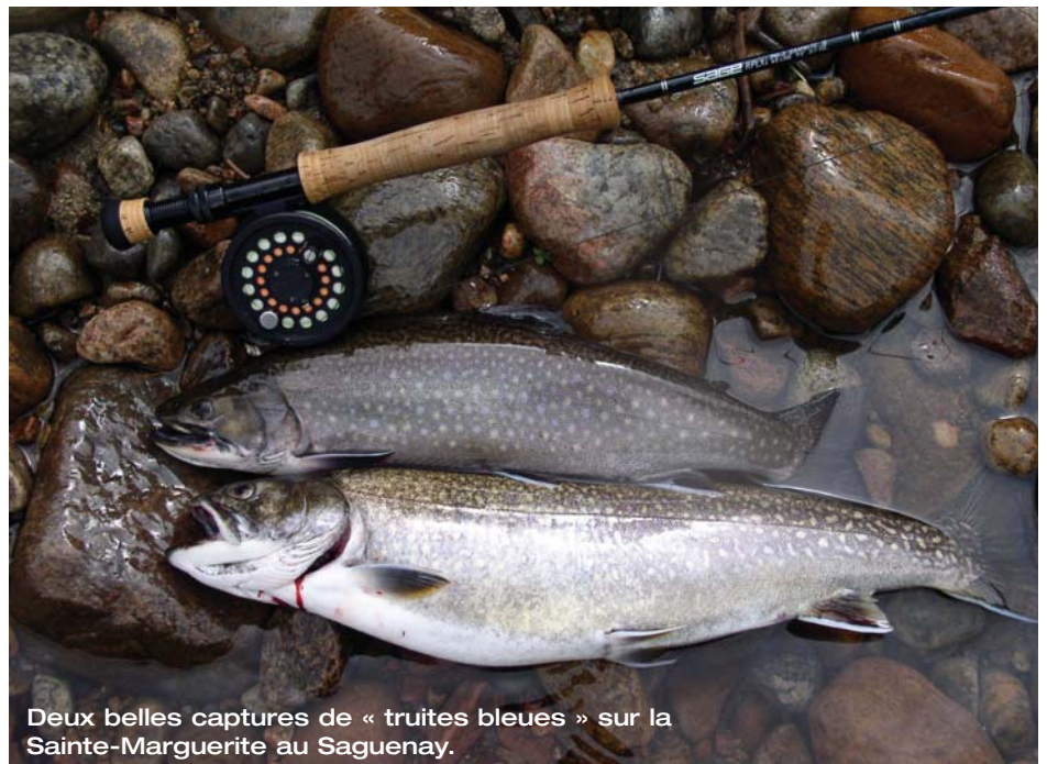
Deux belles captures de « truites bleues » sur la Sainte-Marguerite au Saguenay.

peuvent faire de 5 à 6 livres. Des 50 000 à 70 000 jeunes truites qui ont quitté la rivière plusieurs années auparavant, seulement 500 à 700 se retrouveront sur les sites de fraie. Ces survivants auront par contre de très bonnes chances de se reproduire plusieurs années consécutives (le taux de survie des géniteurs est autour de 30 %). Ce sont ces poissons qui assureront la pérennité de l'espèce, d'où l'importance de les préserver et de limiter leur capture. Ces centaines de poissons sont revenus vers leur rivière natale entre juillet et août, après deux ou trois ans d'allers-retours eau douce-eau salée. Cette fois est la bonne. Tout est en place pour assurer la descendance. Des nouveaux joueurs, souvent oubliés, sont entrés en scène : les truites résidentes. Sur les sites de fraie anadromes, il n'est pas rare d'apercevoir de petits mâles résidents qui tentent eux aussi d'avoir accès aux grosses femelles et qui y réussiront sans doute. Voilà, la boucle est bouclée. Mai suivant verra naître une autre génération ; de jeunes truites issues de différents parcours qui devront à leur tour suivre leur propre destinée, dictée d'une part par l'environnement et, d'autre part, par leur bagage génétique. Gageons que vous ne regarderez plus du tout du même œil votre prochaine capture d'omble fontaine (ou truite de mer) !